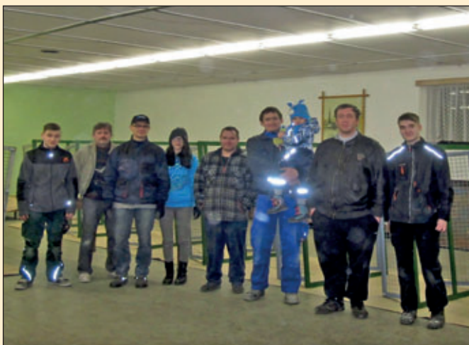
Der Vorstand des RKZV S339 Mühlau e.V.

Das wir die Arbeiten an den Käfigen voraussichtlich bereits im Februar abschließen können ist auch ein Verdienst unserer fleißigen Vereinsmitglieder, die zahlreich an den Arbeitseinsätzen teilgenommen haben. Der Vorstand möchte für diese tatkräftige Unterstützung recht herzlich Danke sagen.