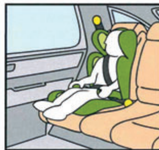
Sitzerhöhung mit integrierter Rückenlehne und Seitenaufprall-Schutz.