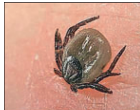
Ein Zeckenstich bleibt oft unbemerkt. Probleme gibt es dann manchmal erst nach Monaten und Jahren