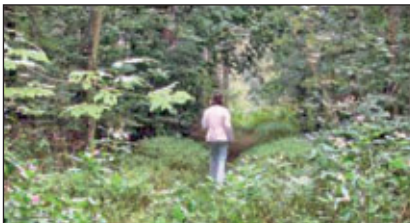
Ein Waldspaziergang ist erholsam und schön, aber Vorsicht ist geboten!