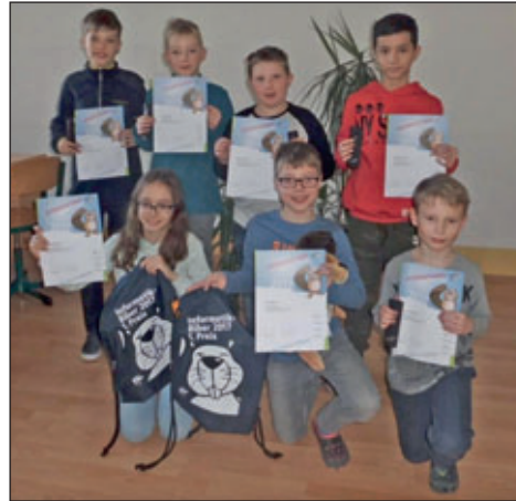
Die Preisträger der Klasse 4